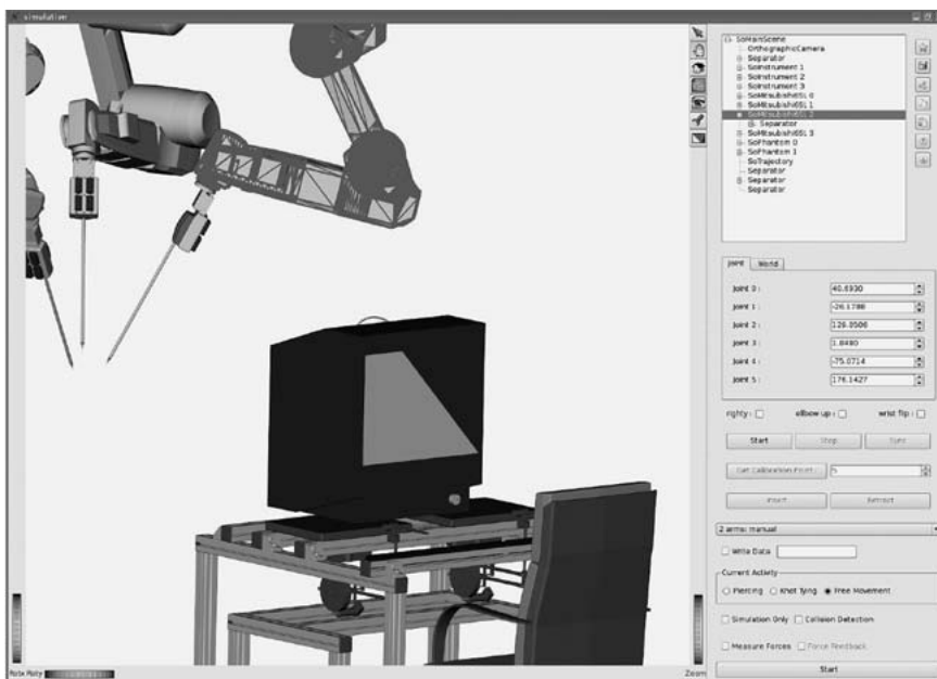
Abb. 2 Die grafische Benutzeroberfläche der ARAMIS Forschungsplattform.

Wenn eine intuitiv bedienbare, intelligente Instrumentenplattform die Optik und die Instrumente in die ideale Position gebracht hat, ist das synergistische Zusammenwirken von mindestens zwei Operationsinstrumenten (Endeffektoren) im Blickfeld der Kamera erforderlich. Um das NOTES-Konzept klinisch umzusetzen, müssen auf diese Weise auch komplexere Manipulationen möglich sein. Wahrscheinlich ist dies nur zu verwirklichen, wenn die Endeffektoren zu einem gewissen Grad autonome Fähigkeiten aufweisen. Die Ausführung von Nähten oder der Knotenverschluss sollten „automatisierbar“ sein, um den Operateur wirksam zu entlasten. Auch zu diesem Punkt existieren bereits Vorarbeiten im Rahmen des Kooperationsprojekts ARAMIS [21]. Im Rahmen dieser Forschungsarbeiten ist es bereits gelungen chirurgische Knoten semi-automatisch durchzuführen. Die erforderlichen sensor-motorischen Zusammenhänge werden dabei anhand weniger Vorführungen des Chirurgen gelernt. Danach kann der Knoten dann an einer beliebigen Stelle innerhalb des definierten Arbeitsbereichs angewendet werden. Aus Sicherheitsgründen werden die dabei durchgeführten Be-